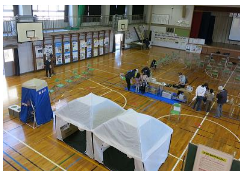
コロナ対策を考慮した防災展

特に、地域の皆様方からの温かいお言葉とアンケート(4頁に一部掲載)から『岩野田防災展』を開催して良かった。今後も、地域の安全・安心を軸にした行事等を計画したいと思います。ご意見・要望等よろしくお願いいたします。