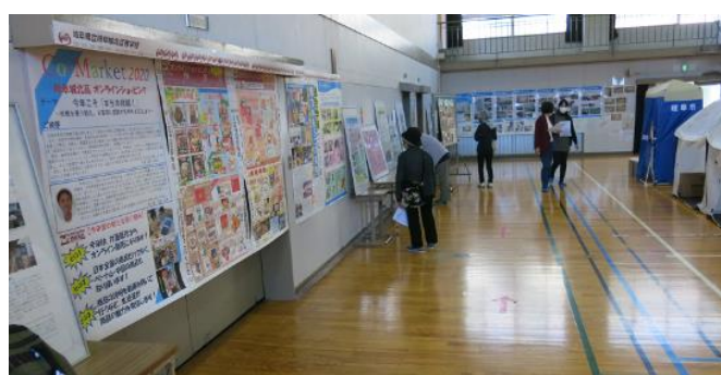
まち協メンバーの紹介パネル