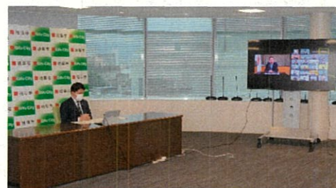
選定証授与式の様子