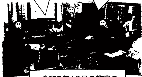
令和3年10月の教室の 様子や参加者の方の言葉

誤嚥性肺炎（ごえんせい はいえん）のことは聞いた ことがあったけど、詳 しく知れて良かった。