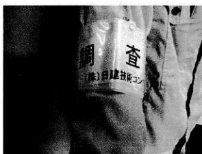
地下水調査 沢水調査

※本調査は、事業の基礎的な情報を収集するために毎年実施する調査です。 ※調査関係者や作業車両は、腕章やプレート等により明示します。