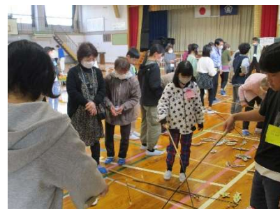
6年生 一人暮らしの高齢者の集い