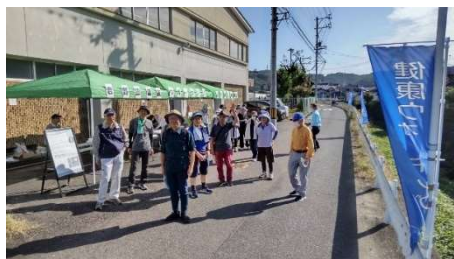
第3回岩野田健康ウォーキング

令和5年度の岩野田健康ウォーキングは青少年育成市民会議主催の「百々ヶ峰登山・ふれあいウォーキング」を含めて4回開催されました。今年、第3回目の健康ウォーキング（令和5年10月7日（土））では、地元の方にガイドをお願いして、岩野田小学校 ⇒