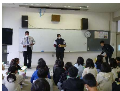
4年生 リサイクル(環境)学習