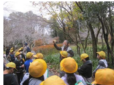
3年生 ふれあいの森探検