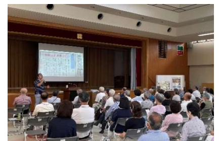
熱心に聴講される岩野田の皆さん

山田先生は以前「岩野田の歴史を語る会」で、地元の皆さんと一緒に岩野田の歴史について調査をされていたとのことでした。懐かしい諸先輩方のお名前が飛び出す昔ばなしに花が咲き、参加者全員楽しいひと時を過ごすことができました。