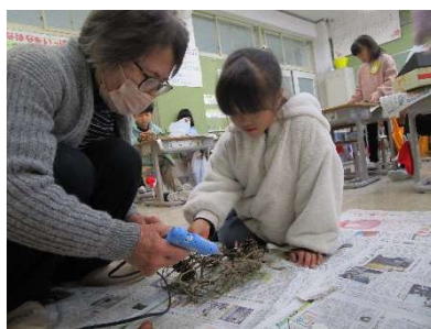
2年生 リースづくり