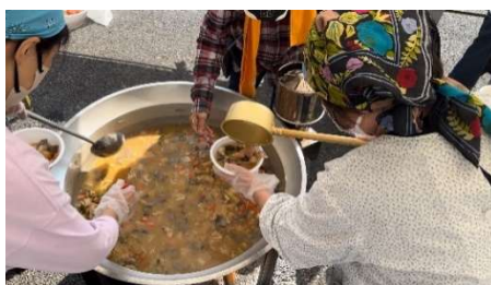
QRコードからYouTube動画がご覧になれます