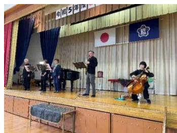
熱演するアンサンブルさくらの皆さん