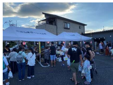
賑わう三田洞東公民館前