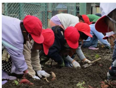
1年生 さつまいも掘り

6年生は、社会福祉協議会、民生委員・児童委員、地域包括支援センターの方々のご協力を得ながら、「一人暮らしの高齢者の集い」を開きました。一緒にゲームを楽しんだり、6年生による歌やリコーダーの演奏を聴いてもらったりしました。また、演芸昭和夢舞台「天下一座チンドン音楽隊」の方にも来ていただき、楽しいひと時を共に過ごすことができました。(岩野田小学校教頭 島部公利)