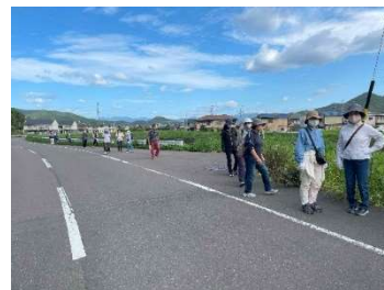
古戦場から岩崎1号古墳へ

令和5年度の岩野田健康ウォーキングは青少年育成市民会議主催の「百々ヶ峰登山・ふれあいウォーキング」を含めて4回開催されました。今年、第3回目の健康ウォーキング（令和5年10月7日（土））では、地元の方にガイドをお願いして、岩野田小学校 ⇒