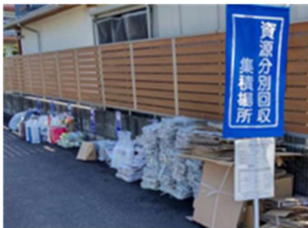
ステーション方式となった資源置き場

岩野田資源分別回収をステーション方式（岩野田で30ヶ所の資源置き場を設置）に変更して6ヶ月、地域の皆様のご協力により順調に回収が行われています。