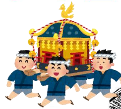
到着次第昼食(みこしカレー)

子どもみこし： 上岩崎公園集合 10:30集合 上岩崎公園 10:45出発 → 岩野田小でトイレ休憩 → JA岩野田支店