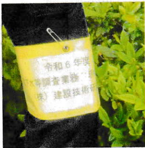
地下水調査 沢水調査

※本調査は、事業の基礎的な情報を収集するために毎年実施する調査です。 ※調査関係者や作業車両は、腕章やプレート等により明示します。