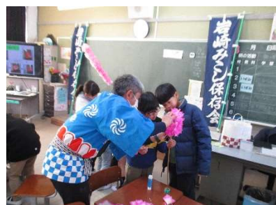
【3年生 岩野田の祭り】

2年生は、岩野田児童センターを訪問しました。地域にある公共施設の使い方、ルールやマナーについて、実際に遊びながら学ぶことができました。公共施設にたくさんのルールがあるのは、「赤ちゃんや障がいのある人など、いろいろな方が使うからだ」ということが分かりました。 3年生は、岩崎みこし保存会の方にお越しいただきました。岩野田の史跡、名所、伝統行事について、小学校の歴史、町の様子についてのお話を聞きました。中でも、みこし祭りについてのお話を詳しく聞き、みこしに飾る「花」の作り方を教えてもらいながら、花づくりにも挑戦しました。「岩野田の祭りに使うみこしのことが分かりました。花の作り方を丁寧に教えてくださったので、上手にできて、うれしかったです。」と笑顔で話をしてくれました。