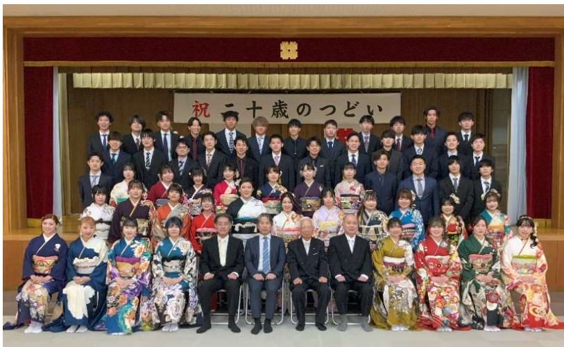
【新たに二十歳になられた皆さん】

1月7日(日)、岐阜市北部コミュニティーセンターにおいて「二十歳のつどい」を開催しました。1月にしては暖かい日差しがさす中、華やかな着物姿や新しいスーツ姿の二十歳になった56名の方にご参加いただきました。久しぶりに再会する学友との懐かしさもあり、皆さん笑顔があふれていました。