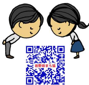
入賞作品は「岩野田まちづくり協議会」のホームページでご覧になれます