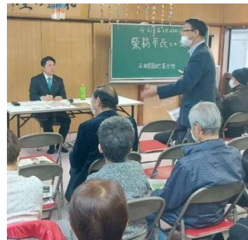
【住民と語り合う市長】