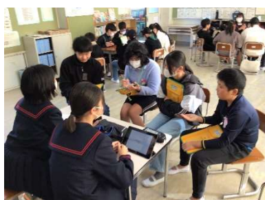
【6年生 先輩と語る会】

5年生は、水防団、消防士、防災士、中部地域づくり協会の方にお越しいただきました。今まで学んだDIGや校区の危険箇所や避難場所を確認した活動のまとめとして、テーマグループ毎に発表しました。今まで撮りためた写真を使ったり、災害が起こった様子を劇で表現したりして、自分たちのアイデアを生かして発表しました。また、地域の方からは、近所の人と仲良くなること、家族と避難場所を今日にでも話し合うこと、どのタイミングで避難するとよいかなど、普段から災害に備えておくことの大切さを教えていただきました。