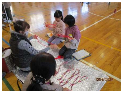
【1年生 昔から伝わる遊び】

令和6年2月3日(土)、岩野田小学校で“地域の力”の協力による、「土曜日等の教育活動」が開催されました。