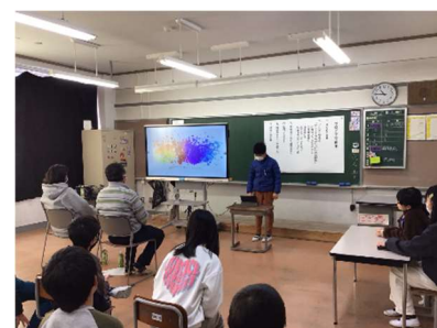
【4年生 リサイクル(環境)学習】

2年生は、岩野田児童センターを訪問しました。地域にある公共施設の使い方、ルールやマナーについて、実際に遊びながら学ぶことができました。公共施設にたくさんのルールがあるのは、「赤ちゃんや障がいのある人など、いろいろな方が使うからだ」ということが分かりました。 3年生は、岩崎みこし保存会の方にお越しいただきました。岩野田の史跡、名所、伝統行事について、小学校の歴史、町の様子についてのお話を聞きました。中でも、みこし祭りについてのお話を詳しく聞き、みこしに飾る「花」の作り方を教えてもらいながら、花づくりにも挑戦しました。「岩野田の祭りに使うみこしのことが分かりました。花の作り方を丁寧に教えてくださったので、上手にできて、うれしかったです。」と笑顔で話をしてくれました。