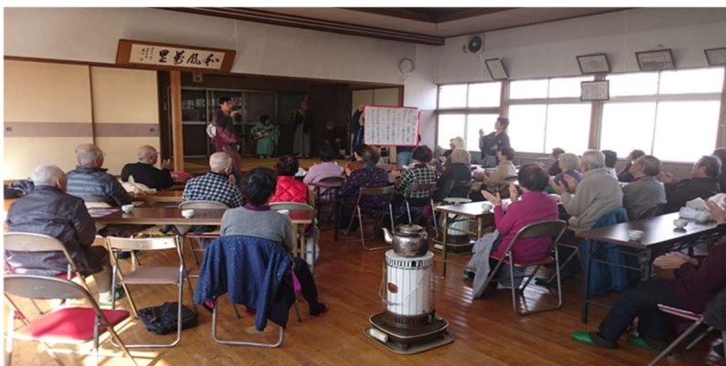
【演芸やカラオケを楽しむ皆さん 岩野田公民館】