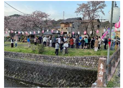
【昨年のさくら祭り】