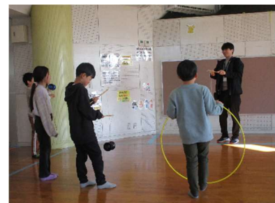
【2年生 岩野田児童センター訪問】

1年生は、岐阜市社会福祉協議会岩野田支部のみなさんにお越しいただきました。けん玉やコマ回し、かるた、お手玉、メンコ、紙飛行機、かぶと、おはじき、あやとり、花いちもんめ、かごめかごめの11種類の「昔から伝わる遊び」を教えていただいたり、一緒に楽しんだりしました。『あやとり』はやったことがなくて、はじめは失敗したけど、やり方を教えてもらって、ほうきが作れたので嬉しかった。」と話しました。